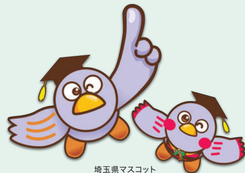
埼玉県マスコット 「コバトン」 「さいたまっち」

※埼玉県多様な働き方実践企業とは、仕事と家庭の両立を支援するため、テレワークや短時間労働など、多様な働き方を実践している企業等を県が認定する制度。