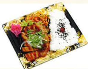
照り焼きチキン弁当