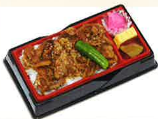
特上牛カルビ弁当