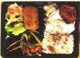
特製日替わりゆめ弁当