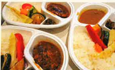
テイクアウトメニュー