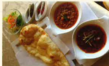
スペシャルセット