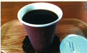
自家焙煎コーヒー