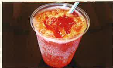
氷いちごサイダー