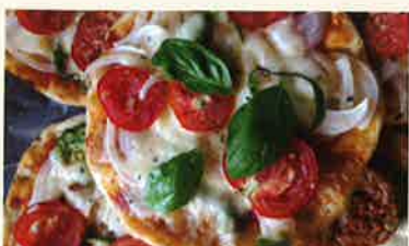
有機野菜ピッツァ