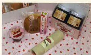
売店にはおみやげ品も盛りだくさん