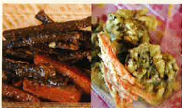
特製 きんぴら/とり天