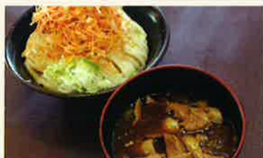
辛ねぎあぶらみそうどん(小)