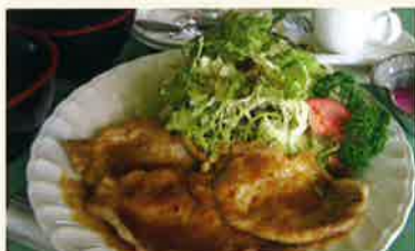
国産豚ロースの生姜焼