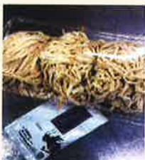
生めん3人前セットスープ付