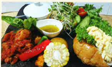
気まぐれランチプレート