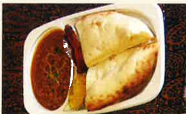
インドカレーお弁当