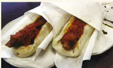
あぶらみそナンドッグ