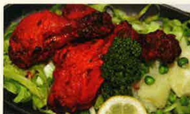
タンドリーチキン