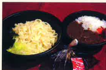
うどんミニカレー丼セット