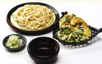
野菜天もりうどん