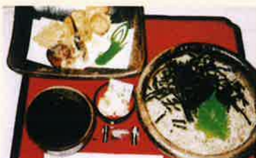
天ざるそば／うどん