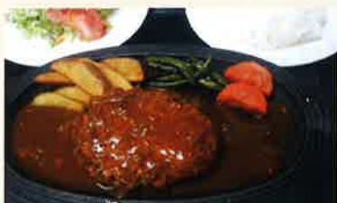
手作リトマトソースのハンバーグステーキ