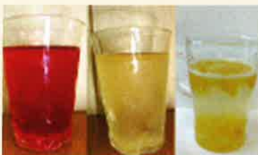
赤じそ・梅ジュース/夏みかんソーダ