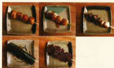
各種厄除けだんご