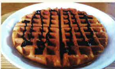
焼きたてワッフル