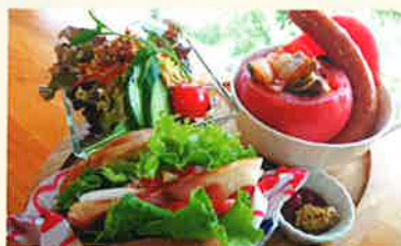
BLTサンド&ラタトゥイユ