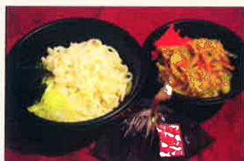
うどんミニかき揚げ丼セット