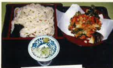
かき揚げ付うどん