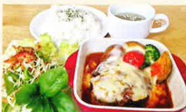
手ごねハンバーグランチ