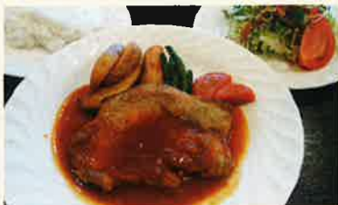
手作リトマトソースのポークソテー