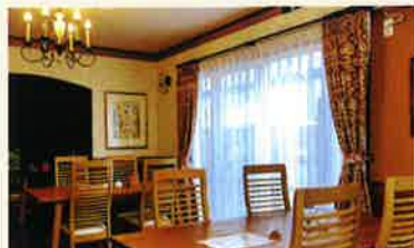
店内はこんな感じです・・・。