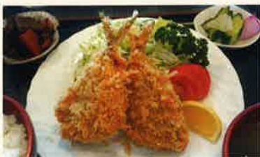
オリジナル鱈フライ