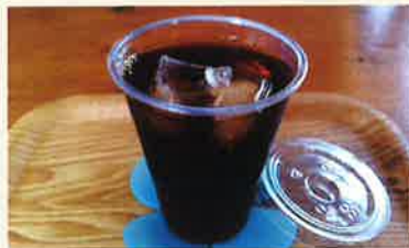
水出しアイスコーヒー