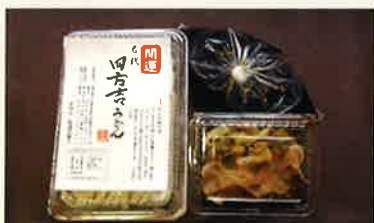
おみやげ肉汁生うどんセット