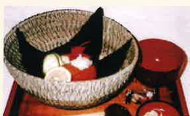
南高梅そば／うどん