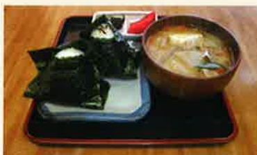
おにぎりと具だくさんとん汁